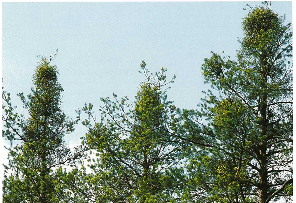
Fig. 2. Peuplement de pins gravement gûité.

de ses hôtes. En outre, le gui des feuillus se distingue de celui des résineux par la nature différente du mucilage de ses baies, appelé viscine (fig. 3).