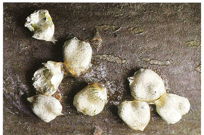
Fig. 5. Graines de gui, aptes à germer, restées dans des fientes d'oiseau (dissémination du gui); d'autres oiseaux de plus petite taille en ont déjà picoré une partie (élimination du gui).