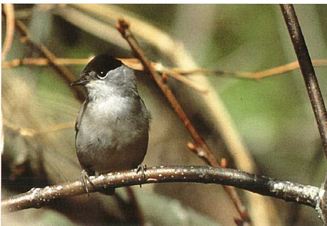
Fig. 4. La fauvette à tête noire est largement répandue tant dans les forêts mixtes que dans les forêts de résineux.

Au centre de ce disque de fixation, un suçoir primaire (organe d'absorption) se développe lentement. Il a généralement besoin de plusieurs semaines pour arriver à pénétrer dans l'écorce du jeune rameau.