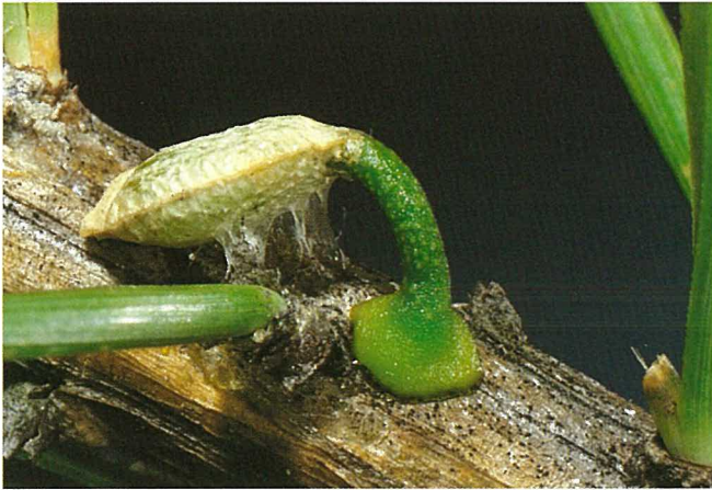
Fig. 7. Graines de gui germant sur pin: On distingue les hypocotyles et le disque de fixation à l'aide duquel la plantule adhère à la branche hôte.