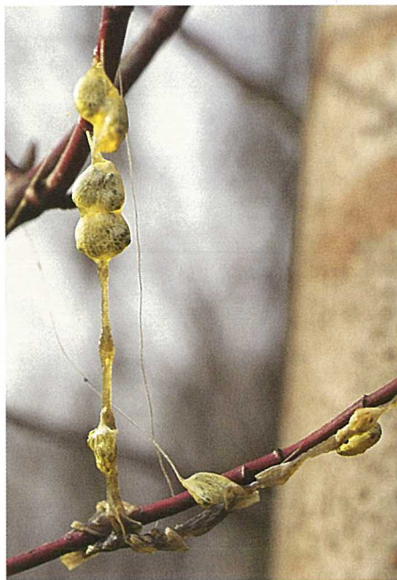
Fig. 3. Graines de gui des feuillus: si l'on écrase les baies de gui fraîches, les graines du gui des feuillus et leur péricarpe restent attachés à de longs fils visqueux. Les graines du gui des résineux par contre se détachent du péricarpe sans former de fils.

Chez nous, les guis sont surtout disséminés par la grive draine (tabl. 2). Si la nourriture est suffisante et le climat propice, elle hiverne en Europe centrale. En outre, plusieurs espèces d'oiseaux migrateurs contribuent largement aussi à la dissémination du gui lors de leurs invasions régulières. D'autres espèces, com-