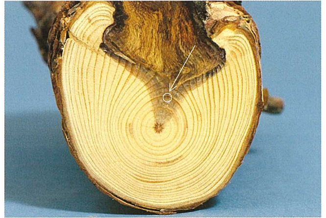
Fig. 9. Coupe transversale d'une branche de pin de 23 ans qui fut gûitée à l'âge de 5 ans (v. flèche). On remarque, sur les 18 derniers cerne, les traces du suçoir primaire: il n'a pas pénétré activement dans le bois mais il est entouré de tissu ligneux.

conditions du milieu et non par une nouvelle infection. A la suite de blessures ou d'une forte attaque d'organismes nuisibles, il arrive que des pousses de gui réapparaissent sur des bourgeons dormants (bourgeons proventifs).