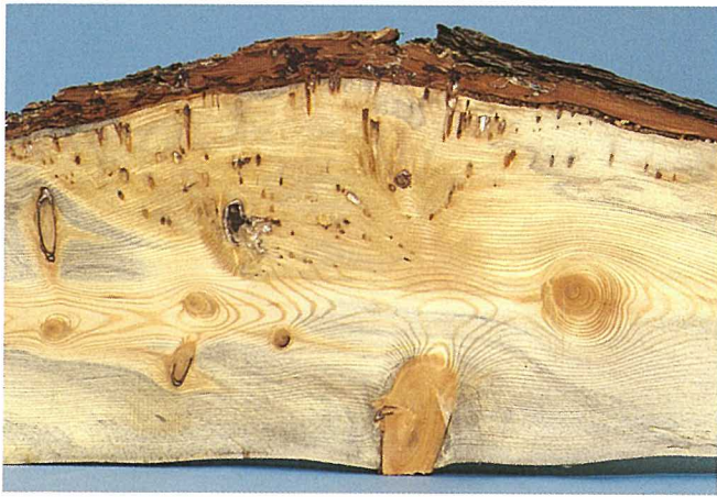
Fig. 10. Coupe longitudinale d'un tronc de pin sur lequel les sucoirs desséchés ont laissé des rangées de cavités.