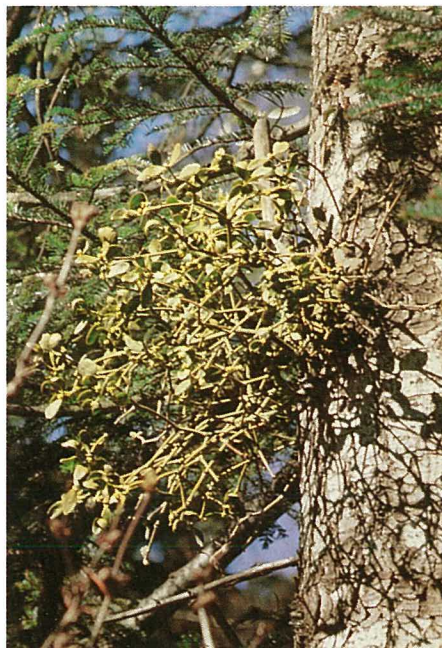
Fig. 12. Gui sur le tronc d'un sapin.

L'utilisation du gui à des fins commerciales est une intéressante source de revenu accessoire à l'époque de Noël.