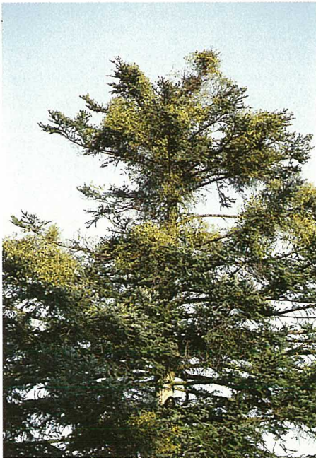
Fig. 1. Sapins blancs gravement gûités.