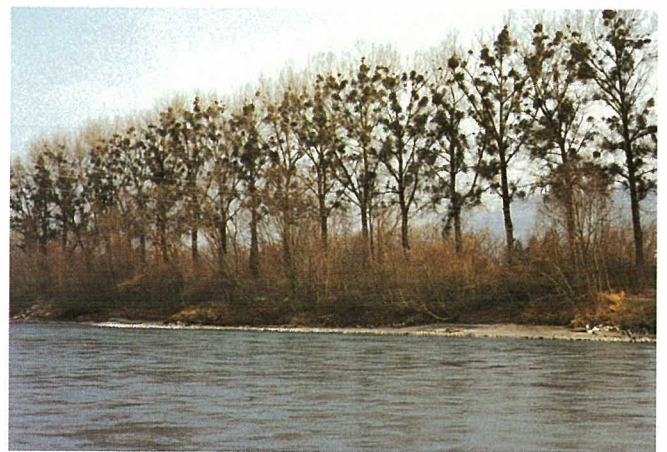
Fig. 11. Rangée de peupliers guités le long du Rhône.